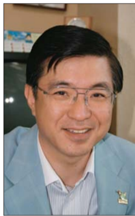
拟任安保辅佐官的磯崎阳辅。