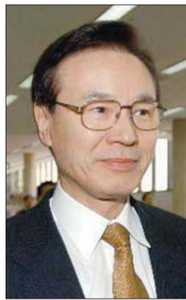
拟任安保局长的谷内正太郎。