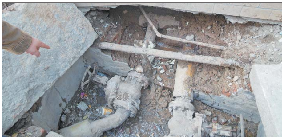
小区外的总阀锈蚀严重,泄漏导致小区不能供暖,将要维修。

小区多位居民向记者反映,“每年都要居民自己掏钱维修,很多居民实在无力承担,建议申请维修资金。”杨先生也告诉记者,虽然总阀由物业负责维修,长此以往也力不从心,“不过根据《山东省物业管理条例》相关规定,小区内的供暖设施不能支取维修资金。”