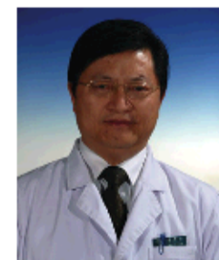
北京广安门医院 李华山教授

据了解，李华山教授现任中华中医药学会肛肠分会常务委员，中国中西医结合学会肛肠专业委员会委员，北京中医药大学肛肠专业委员会常务委员，北京中西医结合学会肛肠专业委员会副主任委员，中国中医药学会广安门医院外科综合党支部书记，主任医师，硕士研究生导师，医学博士，博士后在读。主要从事肛门直肠病的临床与研究工作，擅长治疗痔疮、肛瘘、脱肛、便秘、结肠炎、白(粘)肠病等各种肛肠疾病。李华山教授是我国首位攻读博士学位的中医肛肠专业人员，参与研究的各