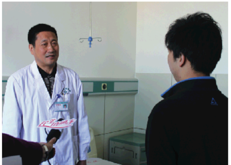
山东公共频道《民生直通车》对活动进行全程跟踪

据悉，本周六、周日北京专家李华山教授会诊期间，痔疮、肛瘘、肛裂、便秘等肛肠病及疑难病患者均可免除专家挂号费、会诊费，同时还将赠送广大肛肠病患者，由于历次北京专家会诊出现患者扎堆就诊的情况，有需求的患者可以选择通过济南肛肠医院24小时热线0531-82979999或登录官网www.jngyy.com查询预约，以免错过会诊良机。