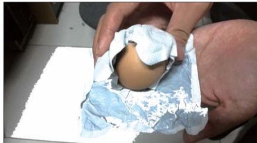
下午2点半,记者用两个暖宝宝贴把生鸡蛋包裹起来。