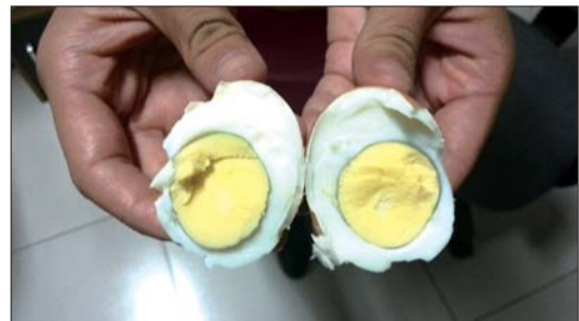
下午7点30分撕去暖宝宝贴后,鸡蛋已经熟了。