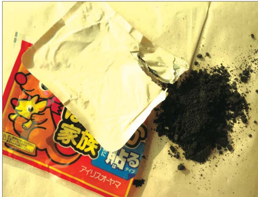
热销的袋鼠牌暖宝宝贴上全是外文说明,内部则是黑色粉末。

天气越来越冷,暖宝宝贴以它一撕一贴就可以便捷使用的优势赢得了爱美女性和老年人的青睐。但也有不少市民反映使用暖宝宝贴后,身上被烫起了水泡。专家提醒,此产品如果使用不当,容易造成低温烫伤,而且并非所有人都适用暖宝宝贴。