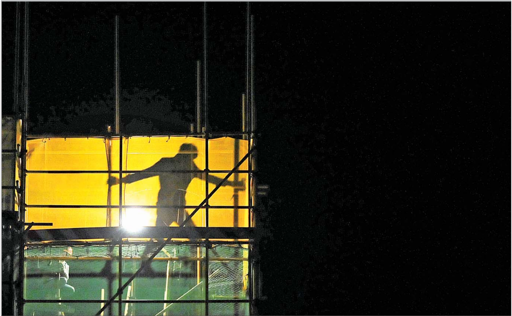
17日深夜,济南和平路一工地内,建筑工人在高高的脚手架上加夜班。