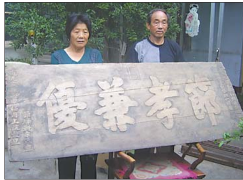
宋姑的后人展示牌匾。

今年夏天,征集碑刻史料,曾见过两块禁赌碑,感慨颇多。追溯历史,赌博之害,由来已久,虽朝代更替,此风不绝。中国古代最早的博戏“六博”,相传出于夏朝末期乌曹之手。乌曹乃夏朝最后一个国王夏桀的大臣。由此可见,赌博游戏在中国已有3500多年的历史了。《唐律疏议》中的“博戏赌财物”一条,首次把“博”与“赌”联系在一起,作为一个法律条文,可视为赌博一词的雏形。