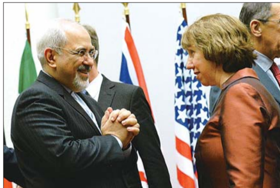
24日,欧盟外交和安全政策高级代表阿什顿(右)与伊朗外长扎里夫在达成协议后露出轻松表情。