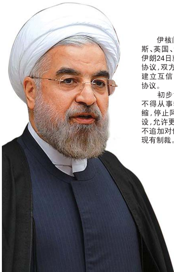
伊朗总统鲁哈尼24日称协议是建立互信的“第一步”。