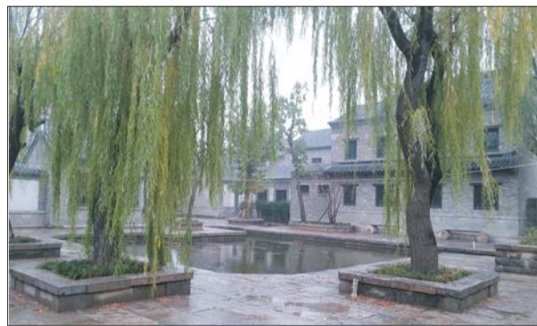
百花洲改造主体工程已完工,百花洲的水通过水渠引入片区内的街巷庭院。

要保留历史真实信息,不是要以古代作为起点,不是“修旧如旧”做仿古一条街。而是要“修旧如故”,保留建筑物原有的信息即可。要把起点定位于开始整治之时,从起点开始保留原有建筑,而不是将之定位于古代,直接仿古。”