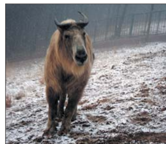
24日,跑马岭下起小雪,金毛羚牛在雪地上奔跑。

本报11月24日讯(记者 孟燕) 24日,省城预报的降雪只在跑马岭等南部山区少数地区“兑现”,省城绝大地区降雪爽约,雨水倒是很给力。