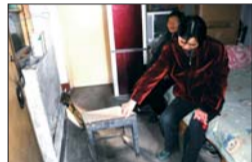
一张只有板凳大小的“饭桌”,一家人用了好多年。