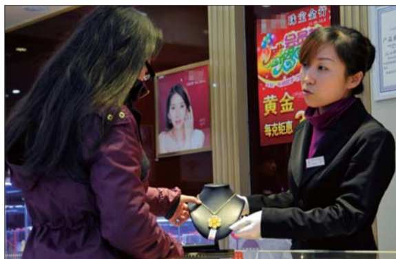
一市民在一珠宝店挑选金饰。

据了解,为了提升销售量,不少金店推出多项优惠活动,比如买18k金、黄金饰品满一千元送一克黄金,买金饰即可参加抽奖活动等。