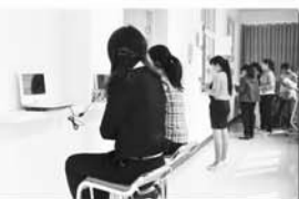
为流动人口提供便民服务