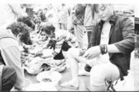
开展端午节包粽子比赛