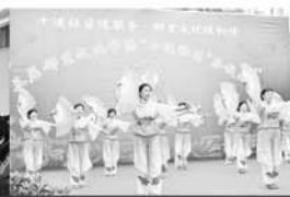
“邻里节”举办歌舞比赛