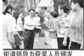
街道领导为获奖人员颁发荣誉证书