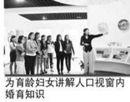
为育龄妇女讲解人口视窗内婚育知识