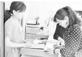
计生专职到辖区门市宣传计生