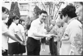
街道领导慰问五好会员