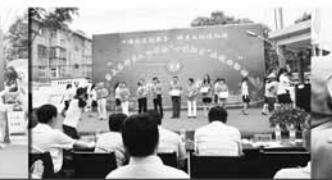
邻里节表彰幸福文明家庭