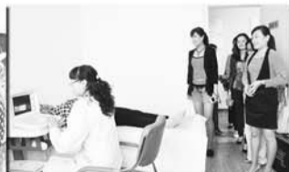
开展“三查一治”健康查体