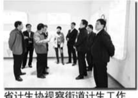
省计生协视察街道计生工作