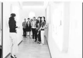
青春期知识宣传一角