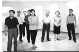
各级领导视察人口视窗