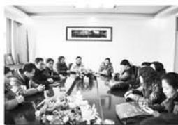
开展社区专职交流会