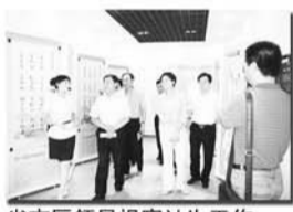
省市领导视察计生工作

坚决打击两非,健全完善利益导向政策体系。 坚定不移地贯彻落实标本兼治、综合施治的方针,实施奖励举报制度,抽调专人组成综合执法组,对辖区医院、诊所及个体药店、保健品店进行清查,严厉打击“两非”。强化利益导向,深入开展“生育关怀”行动,不折不扣地落实独生子女父母、计划生育家庭奖励扶助、城市特困企业独生子女父母退休人员一次性养老补助金等法定奖励政策,加快完善计划生育利益导向政策体系。建立完善对计生困难家庭和独生子女伤残、死亡家庭救助制度。在普惠政策的基础上,研究制定对计生家庭实行优先优惠的具体措施和办法,切实提高计生家庭的受惠程度,增强了计划生育政策的感召力。刘咏梅 白惠