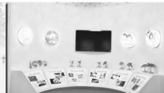
“人口视窗”内的模型展厅