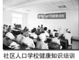
社区人口学校健康知识培训