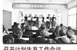
召开计划生育工作会议