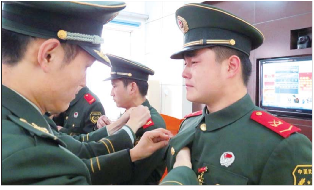
分别在即,铮铮汉子也有柔情,悄然落泪。