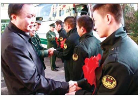
副市长白志坚与退伍老兵一一握手,送他们上车。