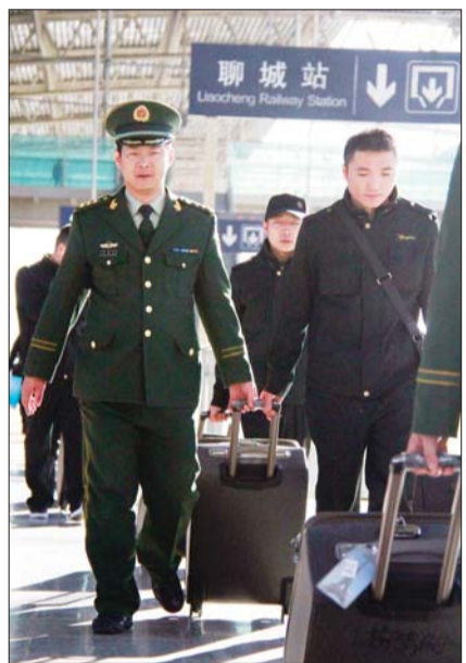
和退役老兵一起拉着行李走到站台。