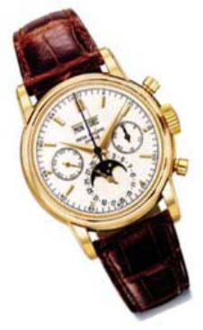
百达翡丽1971年制红金万年历月盈亏手动上弦计时码表型号2499,第三系列,2011年香港佳士得春拍以938万港元成交。

较高的情况下,手表的增值幅度有加快的趋势 值得注意的是,随着名表热的持续升温,钟表拍卖会上越来越多的内地买家开始频繁现身。以香港苏富比为例,有四分之一的买家都是新客户,几乎都来自亚洲,而其中中国内地的买家增长明显,“从投标到成功中标的中国内地买家超过了30%,增幅在5%至10%。”苏富比拍卖行钟表部陈凯磊如是披露。