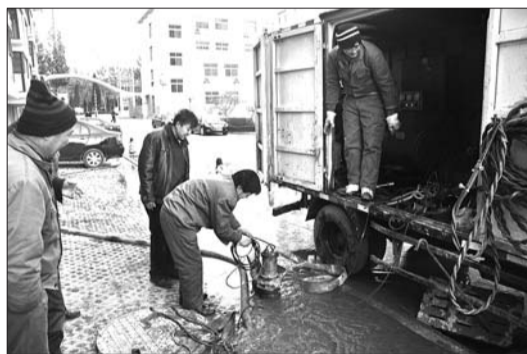
回水越来越多,抢修车上的水泵可帮了大忙。