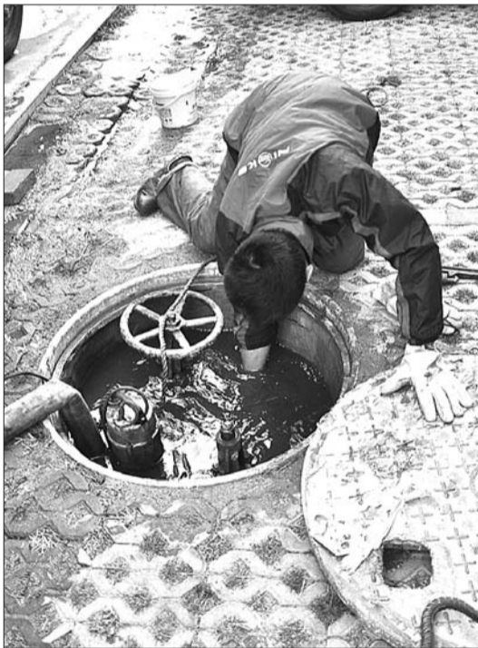
工作人员从热力管道内清出多块淤泥。

“也有可能是流量阀的弹簧片有问题,现在热力公司的工作人员都还在给抢修,再有一个小时差不多就能修完,热力工作人员说先看看供暖效果,不行的话再来修。”27日晚7点左右,该小区物业一名工作人员说。