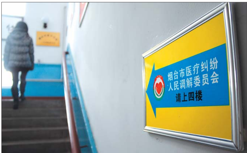
今后,烟台市医疗责任保险将搭载全市医调委,为患方提供更快捷的赔付。