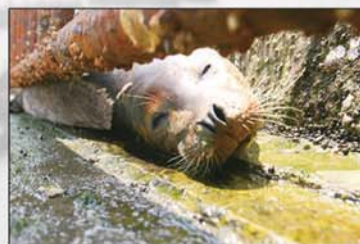
9号海豹 紧急求救。(获2011年山东省新闻奖二等奖)