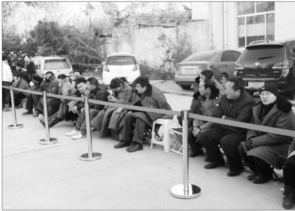
许多排队的市民都裹上了军大衣。

11月30日,山亭锦绣花园二期认筹工作在山亭宾馆展开,为了能抢购到新房,早在11月28日早上9点钟左右,许多市民就已经提前到认筹现场排起了队,并动员全家人齐上阵轮流排队,而据得知正式认筹时间则是30日。