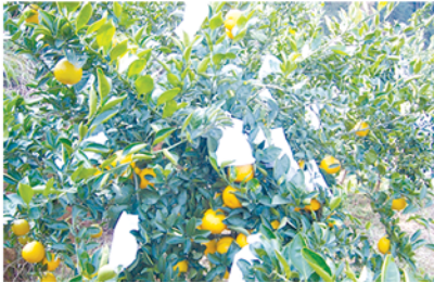
果实套袋防冻技术