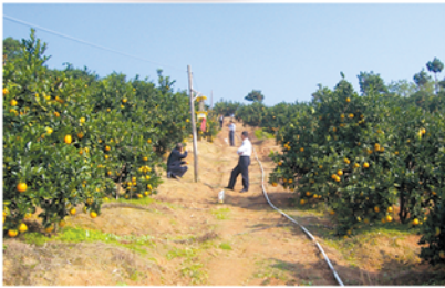
频振式杀虫灯、滴灌技术

时间：12月7日—12月8日(9:00-16:00) 热线：55500900 13065045998