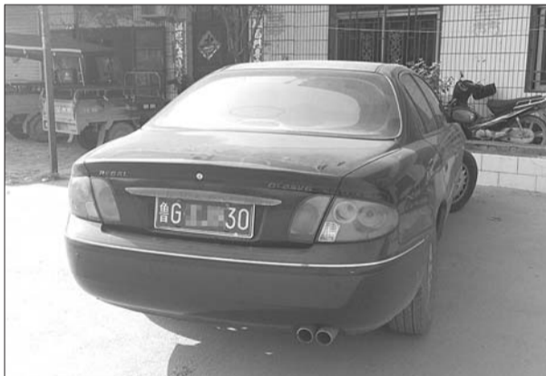
金某和王某去商丘时驾驶的车辆的。