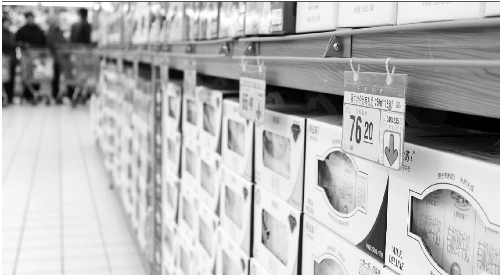
超市内液态奶再一轮上调价格。