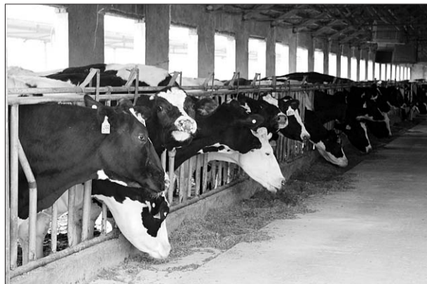
奶牛饲养成本上涨。

“因为不涉及找零,如今热销的2元的小克数鲜奶和酸奶可能会被调整后的2.5元大克数的