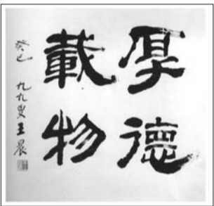
王晨作品 《厚德载物》