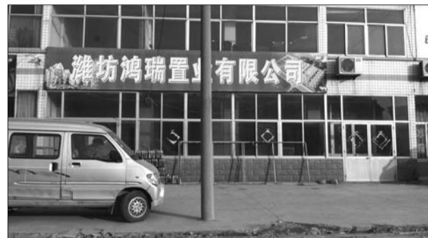
位于水库路上的开发商办公点,每天的工作人员寥寥无几。

另外,记者还得知,当地的政府也正在极力帮助业主解决问题,并且已经走上司法途径,公安、法院等机关已经介入,而当地的政府也为长清花园小区利益受损的业主提供法律帮助。军埠口镇政府的相关负责人称,希望业主通过正规法律渠道解决问题。最终的解决办法,还要等相关的执法部门裁定。