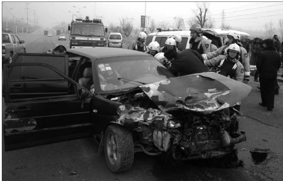
消防官兵一边不断安抚被困司机,一边把车座慢慢后移。

另外,全面普查市场群内消火栓、灭火器和消防通道,协调有关部门对消火栓进行维修保养;协调莱城区制定出台有关文件,督促个体工商户配齐灭火器;协调莱城区和市供销社对消防车通道进行清理整治,确保绝对畅通。依法严厉查处市场群内的消防违法违章行为,用足用好法律手段,无法整改的,坚决予以关停。健全完善官寺市场群火灾扑救预案,深入开展预案演练,确保一旦发生险情,能够迅速到场,科学处置。