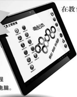
全国首款与中小学辅导课程相结合的智能记忆平板电脑。