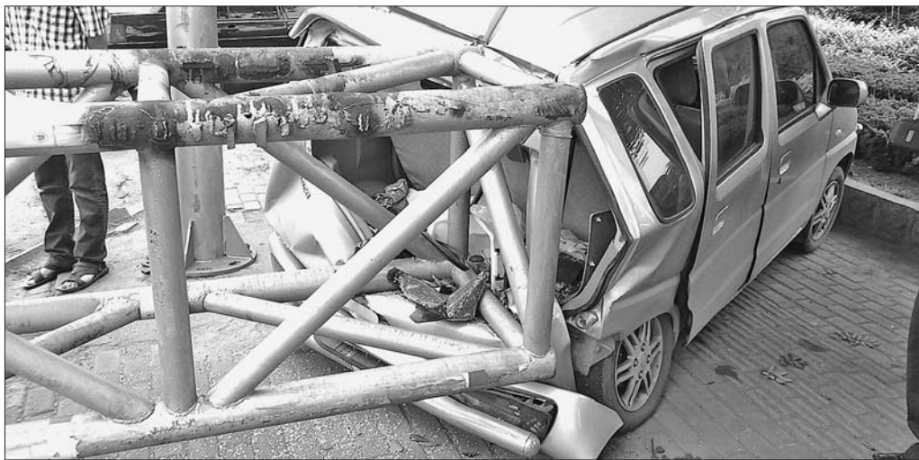
大货车撞倒限高杆,路边的轿车后部被砸扁。(本报7月10日曾报道)