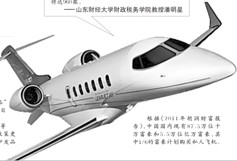
根据《2011年胡润财富报告》,中国国内现有87.5万位千万富豪和5.5万位亿万富豪,其中1/6的富豪计划购买私人飞机。

2006年的消费税调整中,考虑到浴液、洗发水、花露水等护肤护发品已成为人民群众的生活必需品,为使消费税政策更加适应消费结构变化的要求,正确引导消费,取消了护肤护发品税目。