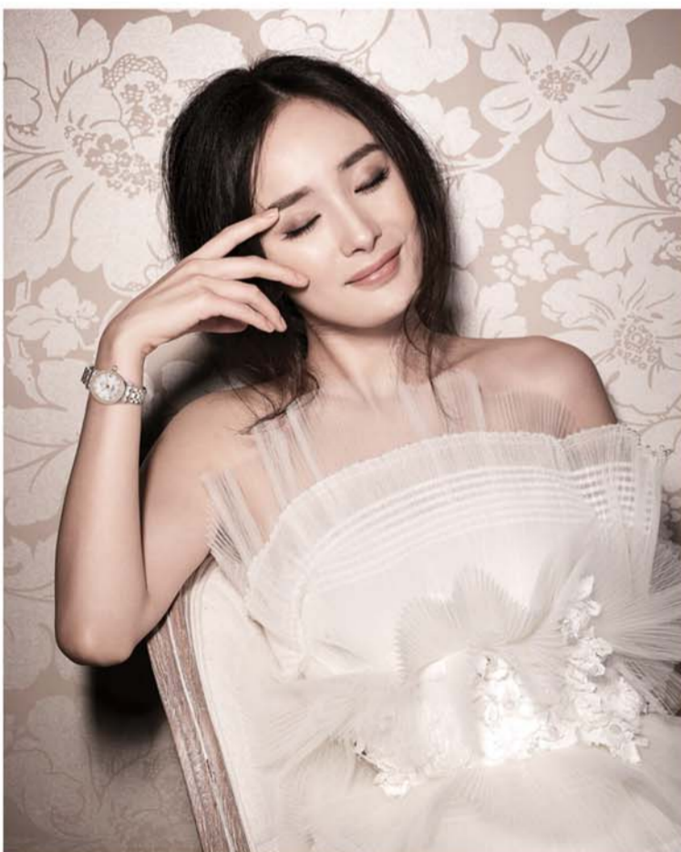
星钻级代言人杨幂展现优雅慧黠气质

为了让更多新一代消费者感受到瑞士英纳格的优雅风范,品牌于去年2012年诚意新一代影视红星杨幂加盟代言,引领年青一族体验「超越时间,成就非凡。」的品牌精神,触发新世代腕表风尚。杨幂俱洋溢着的青春魅力,精灵慧语双眼,闪动着睿智光芒;尤其英纳格腕表拥有着精锐机芯,让人难以抵抗的灵巧工艺,她甜美灵巧外型,活泼聪敏笑容,散发出与众不同的魅力;如同英纳格所设计的每款腕表般变化多端,兼具时尚设计和实用功能的经典之作。拥有聪敏慧语天资的杨幂,正是现代女性生活典范,这种独特个性,成就她闪亮银色旅途,让她能完美地展现瑞士英纳格品牌精神。