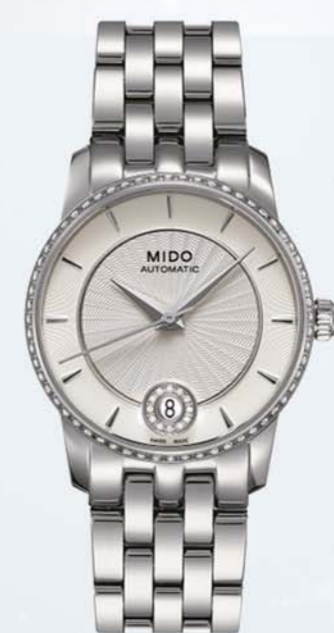
美度贝伦赛丽系列女士钻石腕表 建议零售价14,700 RMB

圣诞夜,或许你永远都愿意相信,那些礼物,一定被赋予了来自这个“金”装“银”裹的节日里最美好的祝福。瑞士美度表精选一金一银两款贝伦赛丽系列腕表,在这个浪漫温馨的特殊节日里,两种不同角色,由你选择。