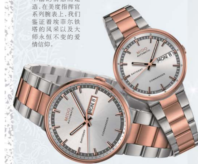
美度指挥官系列男士腕表 建议零售价8,100RMB

灵感源自世界著名建筑埃菲尔铁塔,1884年,埃菲尔为向挚爱玛格丽特表达忠贞不渝的情感而建造,在美度指挥官系列腕表上,我们鉴证着埃菲尔铁塔的风采以及大师永恒不变的爱情信仰。