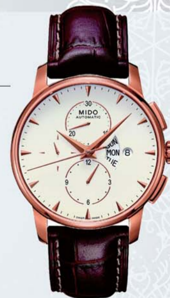
美度贝伦赛丽系列多功能机械腕表 建议零售价14,100 RMB

这枚同样来自于美度贝伦赛丽系列的多功能机械腕表被设计者赋予了更多来自欢欣金色的灵感妙想,整个腕表呈现出非凡独特的个性以及低调奢华的品质,宛若一位圣诞夜盛装起舞的精灵,在欢愉的金色华彩中尽情释放对未来的无限憧憬与热情。