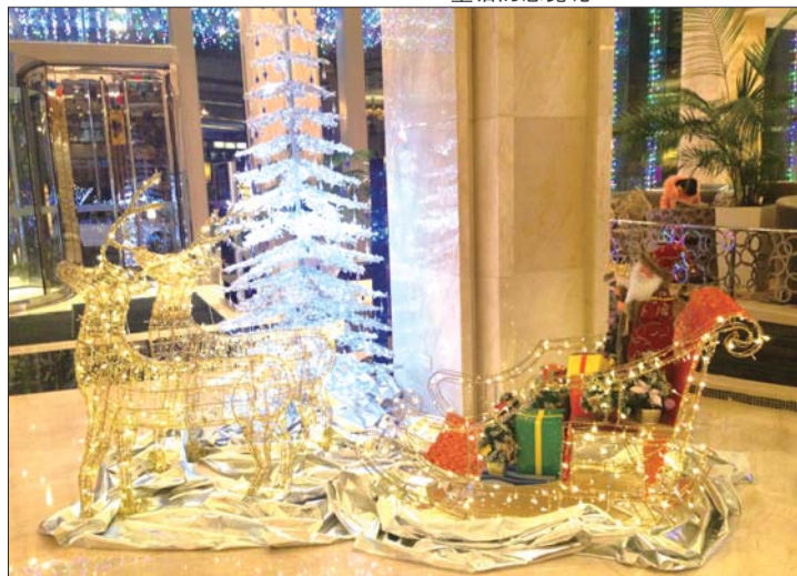
▼百纳瑞汀酒店1楼 圣诞老人坐在装满圣诞礼物的雪橇上,大家快来抢礼物吧!