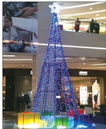
▲振华商厦 圣诞树上挂满闪闪的小灯,非常美丽吧!

圣诞节期间,看到漂亮的圣诞装扮总是忍不住多停留一会儿,能拍照留念就更好了。下面记者就为您推荐几个非常漂亮的圣诞美景,大家在这几天可以留意一下哦!碰巧路过的时候,就可以拿出手机等拍摄工具,拍下这美好的景色!