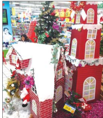
▲大润发超市 红色的圣诞房子,有没有安徒生童话的感觉呢?