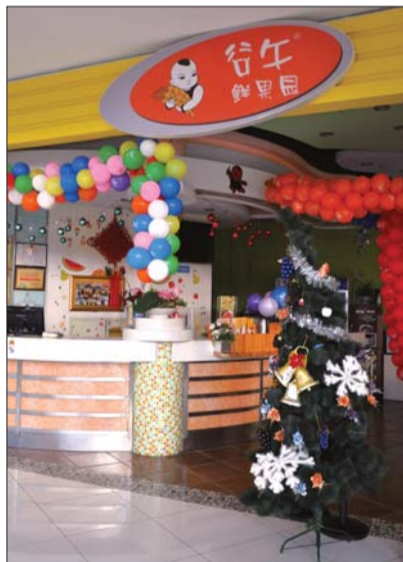
▲世茂广场2楼谷午港式涮乐锅 气球与圣诞树的结合,突出欢乐活泼的圣诞氛围。