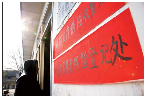
一村民准备到合村社区服务中心填写失地村民认定表。