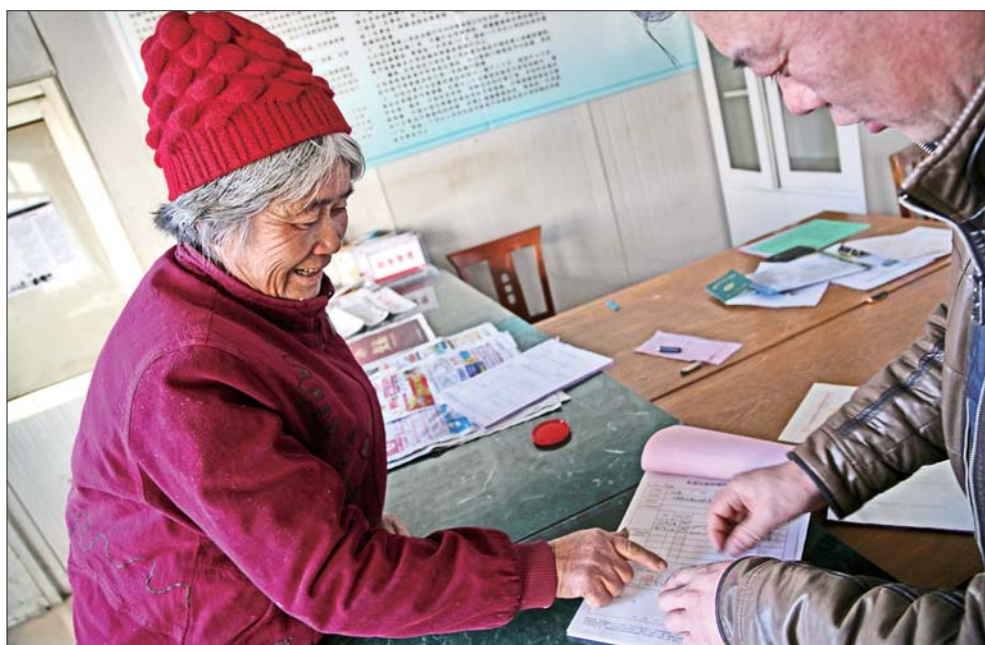
东港区合村的一位准备参加失地养老保险的村民在填写完失地村民认定表后,按上手印表示确认。