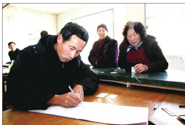
东港区合村社区服务中心内,工作人员正在帮助参加失地养老保险的村民填写报名表格。