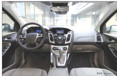
人机交互界面,时刻为你提供最及时的行车信息。