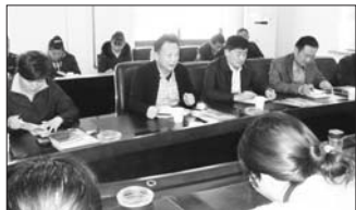
街道召开党委会研究打击“两非”工作

孕情不明原因消失对象、政策外怀孕引产女婴对象、外寄假避孕节育情况报告单等六种重点对象逐居逐户过筛,对可疑对象先通过外围排查,有选择地进行重点突破。加强流动人口避孕节育情况的排查。严格落实流动人口“四术”随访制度,在随访过程中除了解育妇术后身体情况外,还了解医疗机构是否存在非法B超或终止妊娠行为。加强对辖区黑诊所和非法行医人员的排查。发动居委会对辖区个体私人诊所进行全面排查,对涉嫌“两非”的继续监控,适时突破和报上级相关部门处理。