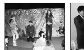
庄户剧团演出关爱女孩内容的节目