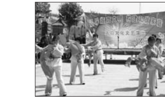
倡导婚育新风文艺演出