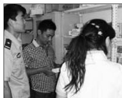
每季度开展一次联合查验药品店