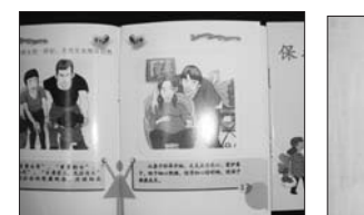
打击两非漫画宣传册