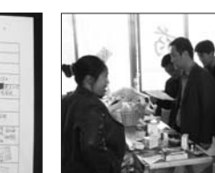
联合查验保健品店