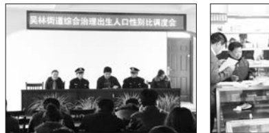
打击“两非”专项行动调度会