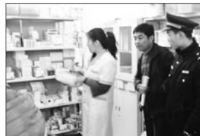
综合执法组检查私人诊所