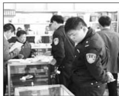
综合执法组查验药品店