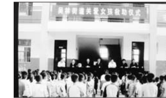
关爱女孩救助仪式