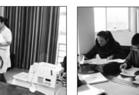
区综合治理性别比办公室督导打击两非工作