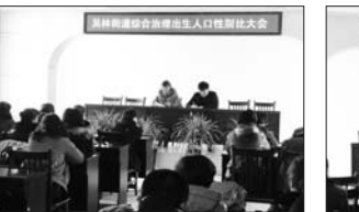
召开综合治理性别比推进会