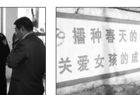
粉刷关爱女孩打击两非漫画墙