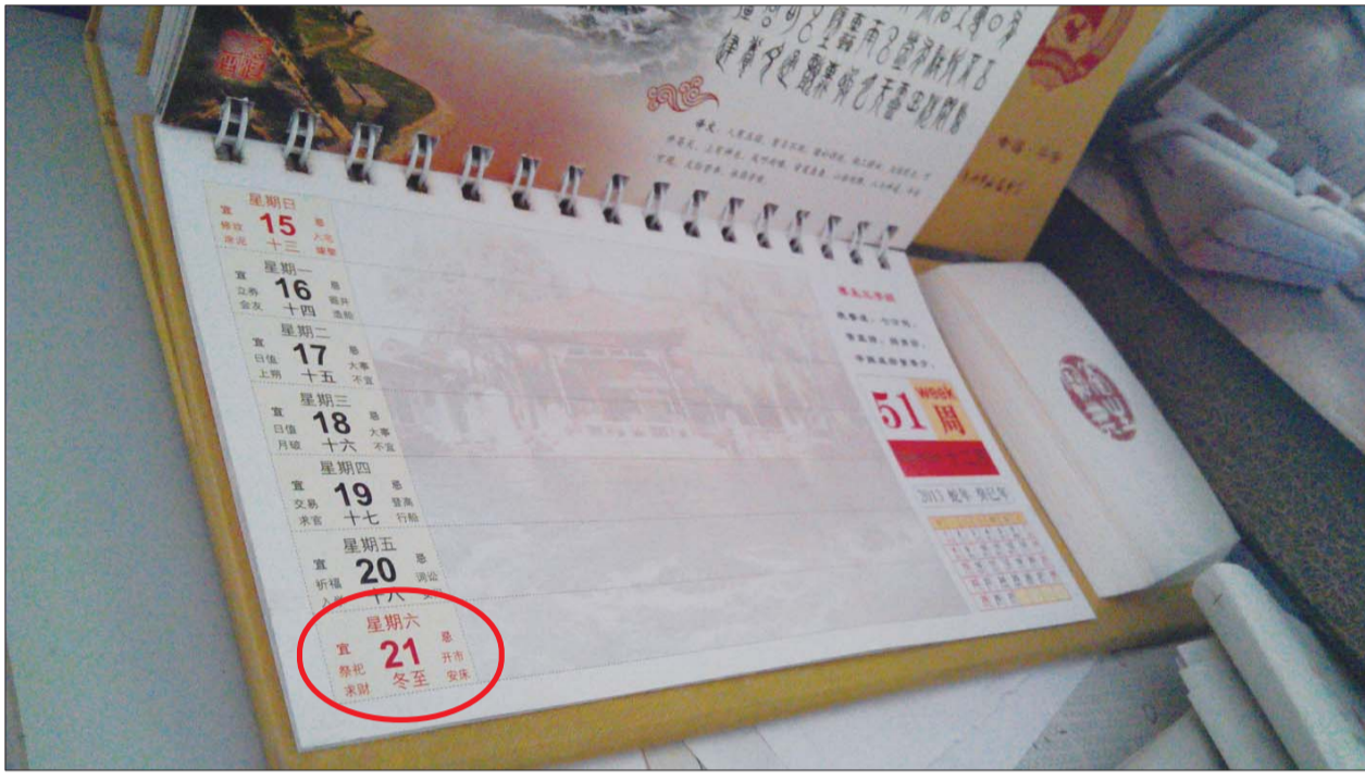
一本台历上显示今年冬至为12月21日。