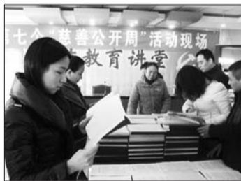
市民在查看账本。

本报济宁12月24日讯(记者晋森 通讯员 路笃书) 24日,济宁市慈善总会举办第七个“慈善公开周”活动,继续面向社会“晾出”资金募集、财务管理等项目,来自社会的监督员、捐赠者以及市民,都可以对慈善总会的工作进行监督评议。