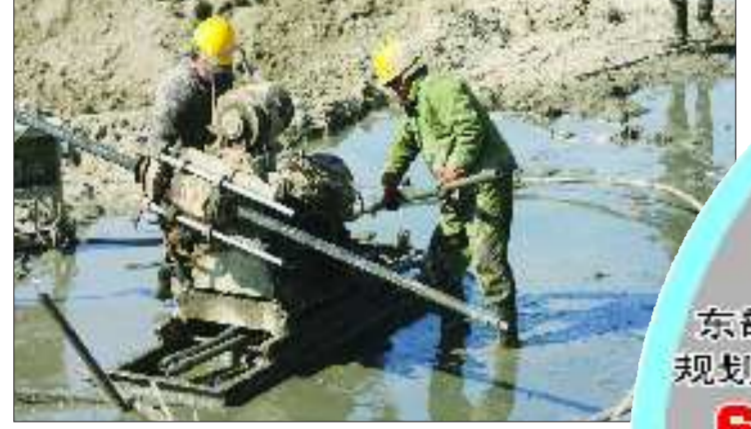
3月20日，烟台海洋产权交易中心工程现场，工人站在泥浆里施工，非常辛苦。

动，他的内心有了一次次的萌动。驾车从滨海路一路向东，一天一个模样的滨海新貌让他停下了脚步，他时常会在回家路上停下车，看看路边的规划，探探施工的现状。