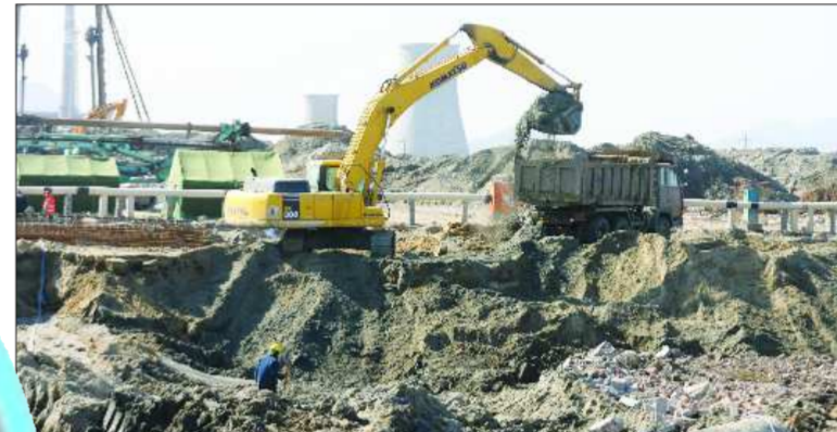
3月20日，烟台海洋产权交易中心工程项目部，工人正在加紧施工。记者 赵金阳 摄

但是，很快小李就转过弯儿来了，因为，他觉得将来随着东部新区发展，这里必将是一块宝地，几年以后东部将会崛起一座新城。将来，不管是基础设施还是生活便利度，绝对不会比市中心区差。