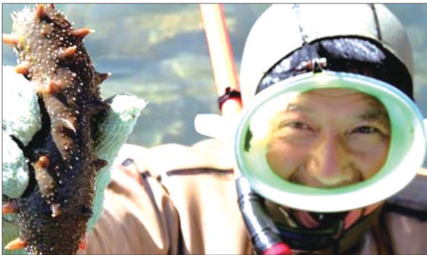
养殖基地的工作人员展示刚刚捕捞出的海参。

抢购热线:15606334343。 活动时间:1月4日-1月5日(本周六、周日)8:30-17:30 活动地点:齐鲁晚报《今日日照》编辑部。市民可乘坐9路、11路、18路、30路、34路公交车到市建委站下车。