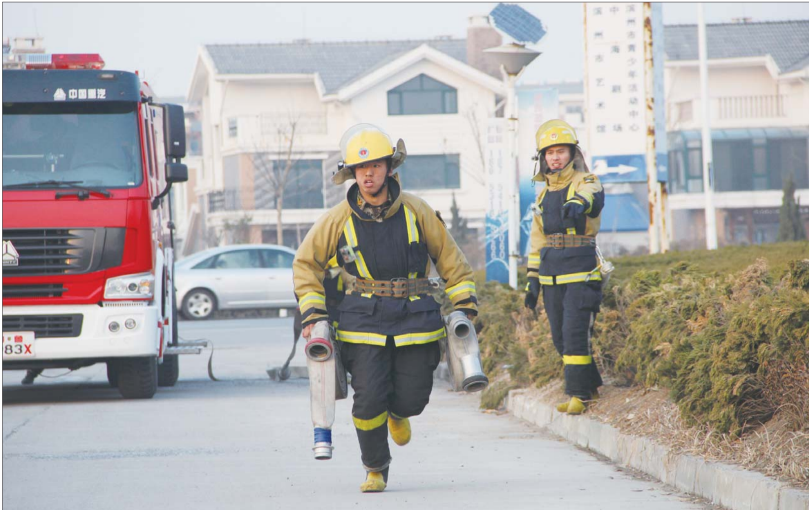
时间就是生命,奔跑是消防战士的基本功。