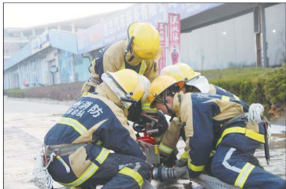
三名消防战士将水带接上。