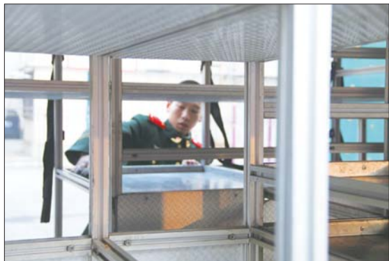
每次训练结束,战士们都要把消防车擦拭干净。