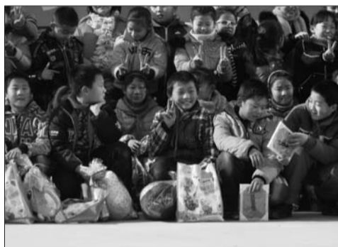
收到礼物真开心! 小记者与峪门小学的学生结对子,来个友好的拥抱。