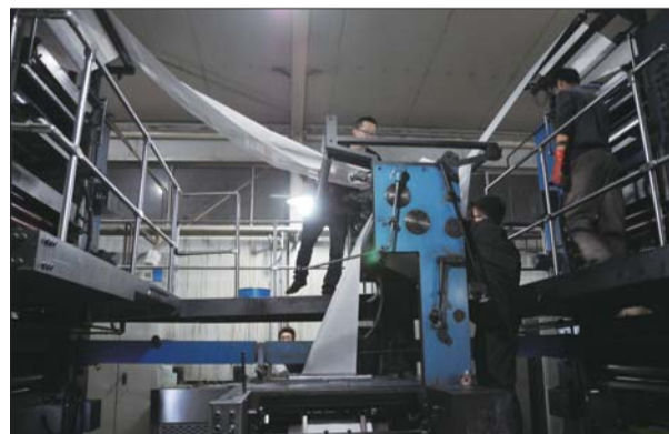
▲工作人员在做印刷前的最后准备。