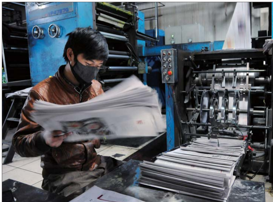
▲工作人员在整理报纸。