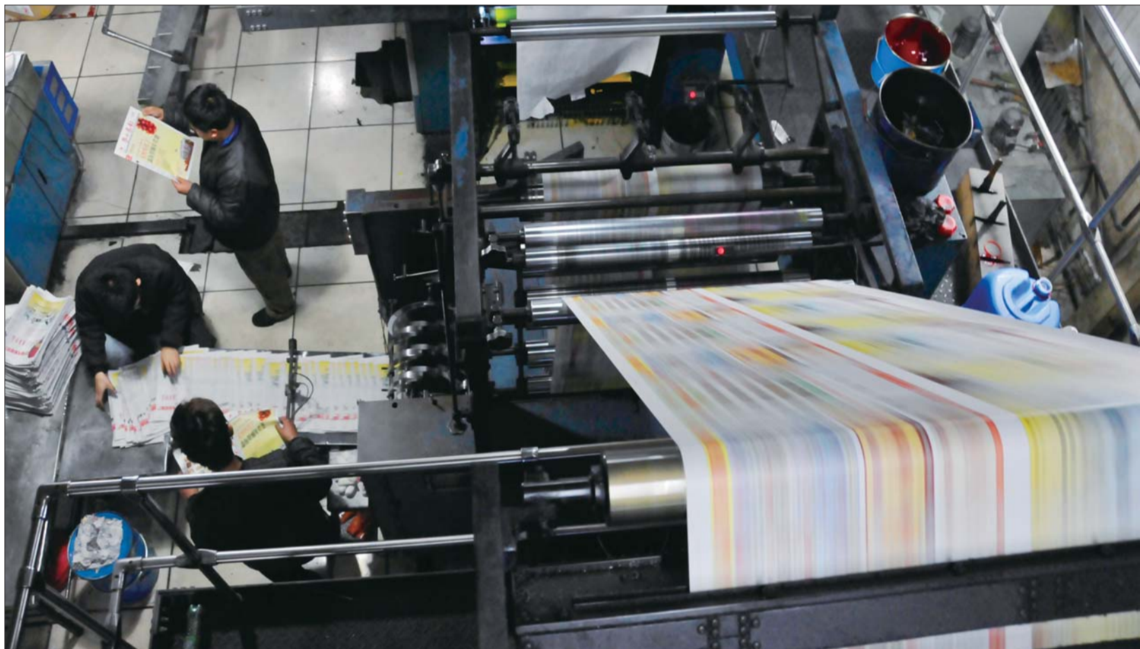
▲印刷机器启动,报纸就这样“出炉”了。