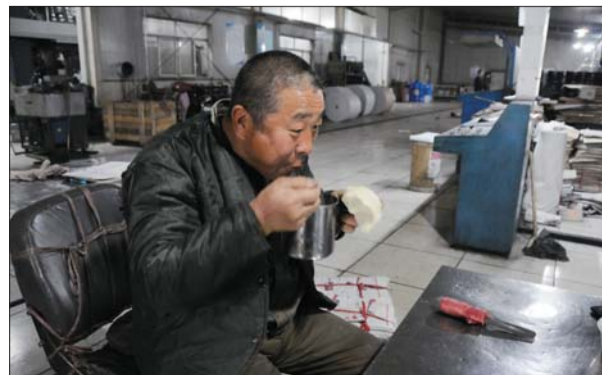
▲工作人员利用印刷前的空闲时间吃饭。