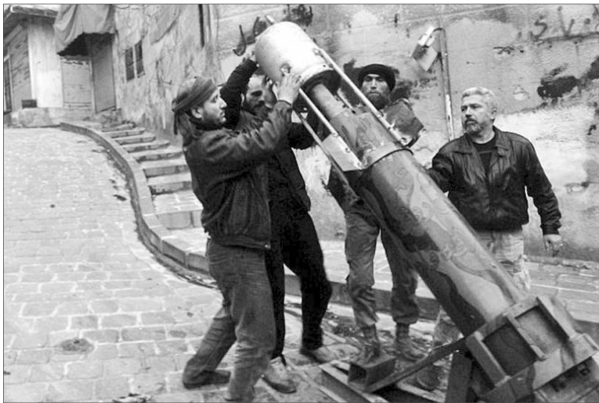
叙利亚反对派士兵最新发明的武器——用排水管改造而成的“迫击炮”。

本报讯 据英国《每日电讯报》1月1日报道,中国驻英大使刘晓明日前称,安倍晋三领导下的日本正寻求改写其在第二次世界大战中的角色,并恢复其激进军事力量的地位,日本试图重燃曾经导致第二次世界大战的军国主义精神,这将使得世界和平遭受严重威胁的风险。报道称,刘晓明对日本首相安倍晋三的所作所为做出强烈谴责,指责其故意在亚洲地区制造紧张氛围,并且把世界绑架到危险的道路上。刘晓明比喻现代日本犹如哈利·波特故事中“很难死掉”的恶棍“伏地魔”的现实版。日益升级的中日争端已经增加了人们对中日将在亚洲发生军事冲突的担忧。针对安倍种种倒行逆施的行为,刘晓明还表示,他认为英国爱好和平的人们不会漠不关心。据环球网