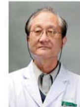
周兴亮 中国畸形疤痕修复鼻祖

一名医生同时做多项工作，自然不能全面精通。在韩国，专业医生只做专业的事。在韩氏，疤痕修复由多位专业疤痕医生专职进行，以其丰富的经验，努力将其做到极致。