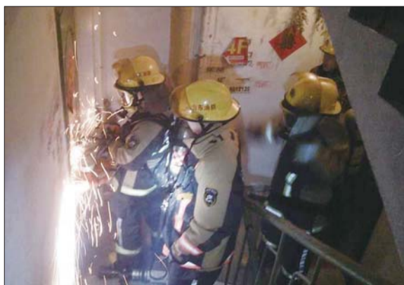
消防人员正在对防盗门进行破拆。