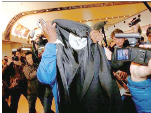
1月9日,埃里克·弗洛伊德从朝鲜飞抵北京,他蒙着脸不让等待的记者拍照。

金刚山旅游曾是朝韩主要经济合作项目之一,2008年7月,一名韩国女游客因误入军事禁区而遭朝鲜士兵射杀,这一项目随后中断至今。 自金正恩1日在新年讲话中强调必须营造气氛改善朝韩关系以来,朝鲜劳动党机关报《劳动新闻》、朝中社等主要媒体连续发表文章,呼吁按照“我们民族”的原则自主实现“祖国统一”。分析师说,这显示朝鲜寻求把握朝韩关系的主动权。 据新华社