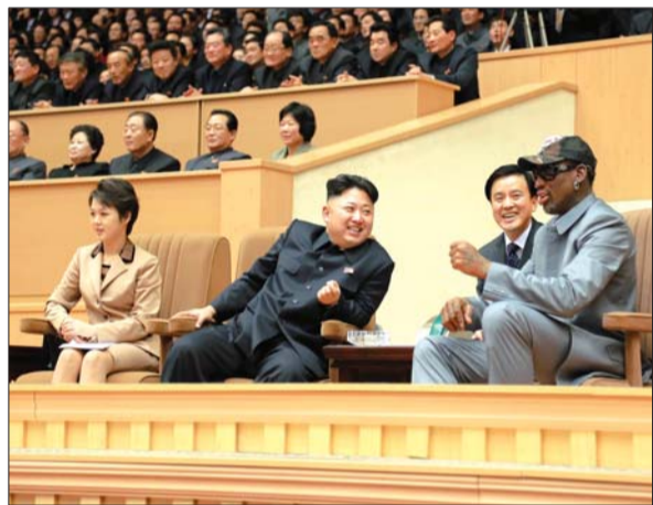
这张朝中社1月9日提供的照片显示,金正恩(前左二)同夫人李雪主(前左一)与罗德曼(右一)观看友谊赛。 新华社发

作为朝鲜分管北南关系的部门,祖国和平统一委员会尽管拒绝韩方提议,但在通知书中没有使用那种典型的严厉措辞,并且提出会谈的条件。分析师说,这显示朝鲜并不希望完全断绝与韩国的关系,因为朝鲜需要外部投资和援助,以实现最高领导人金正恩在新年讲话中所提经济建设和改善人民生活水平的目标。 首尔大学和平统一研究所高级研究员张永硕说,朝鲜之所以急切希望重启金刚山旅游,是因为来自韩国的投资将有利于吸引其他外国投资。