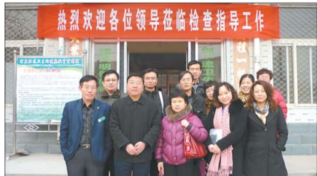
市局专家组对五峰进行公共卫生服务考核。