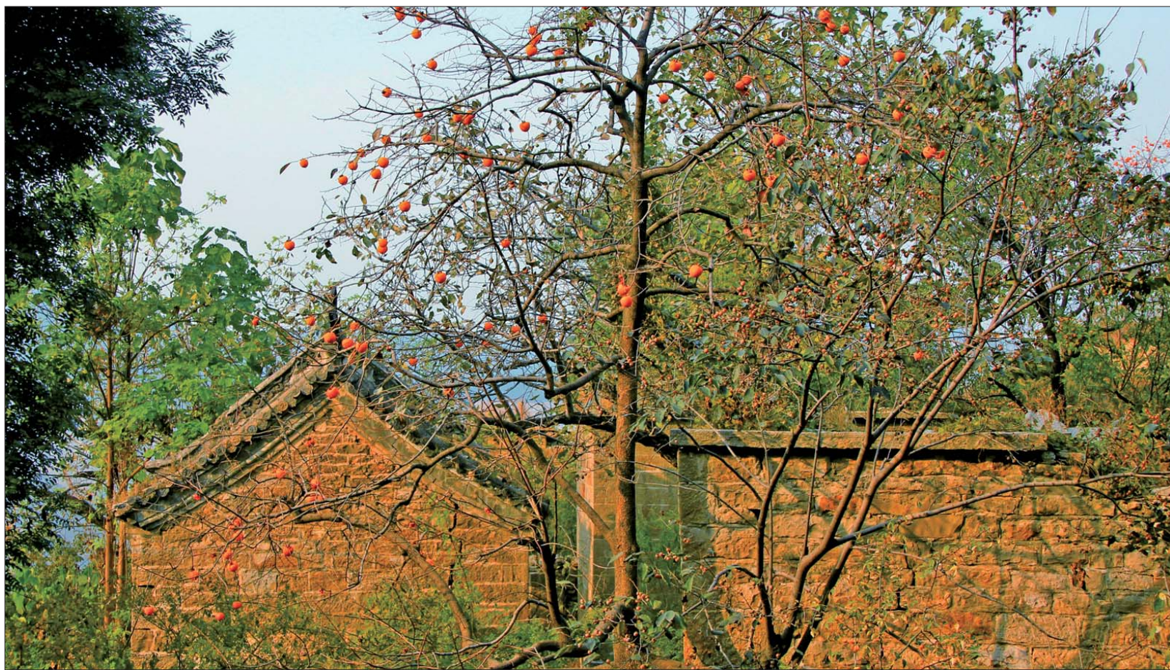
三教堂被各种树木包围,尤其是柿子树不少。