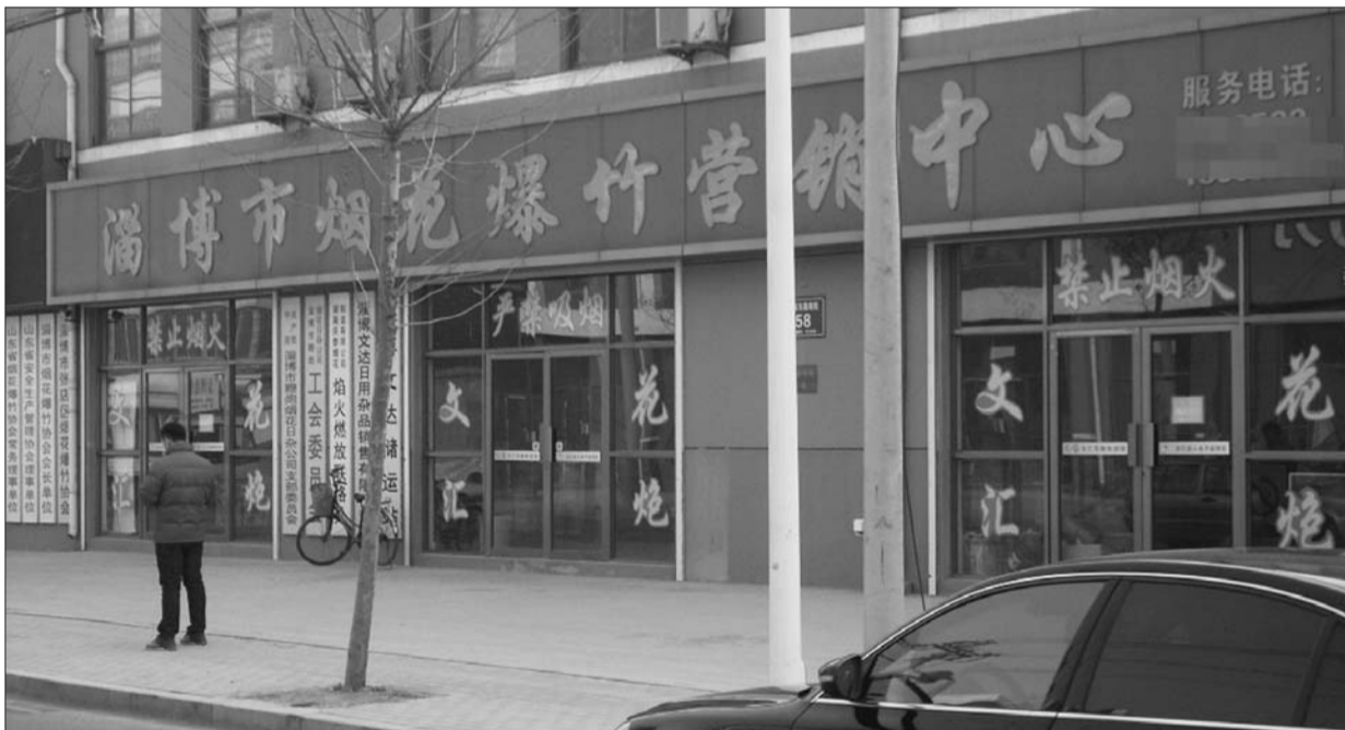
市烟花爆竹营销公司生意冷清。

“爆竹声中一岁除,春风送暖入屠苏”,春节将至,春联、大红灯笼、烟花爆竹、各类年货等正走上大街小巷。记者调查发现,随着中纪委下发《关于严禁元旦春节期间公款购买赠送烟花爆竹等年货节礼的通知》和市民对于空气污染的关注度不断上升,2014年旺季的烟花爆竹市场遭遇节前“寒冬”。