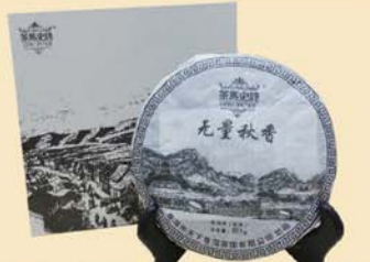
无量秋香:百年古树·2012年秋茶