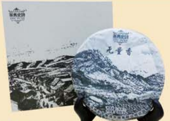
无量香:百年古树·2012年春茶、秋茶