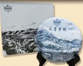
无量单株:百年单株古树·2012年春茶