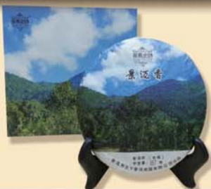
景迈香:千年古树·2012年春茶、秋茶