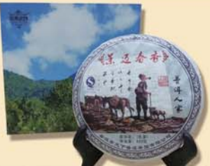
景迈春香:千年古树·2012年春茶