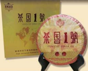
茶国一号:百年古树·2013年春茶