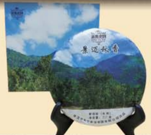
景迈秋香:千年古树·2012年秋茶