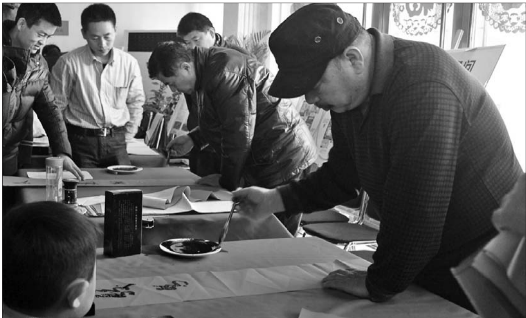
书法家们现场挥毫,市民们在旁耐心等待。

本次活动由齐鲁晚报《水城书画》理事会组织,《水城书画》成立了由权威机构和各界名家组成的理事会,组建了一支阵容强大的笔会队伍,通过各种形式来举办书画名家笔会、名家作品平面展、摄影名家平面展、个人专题展等。