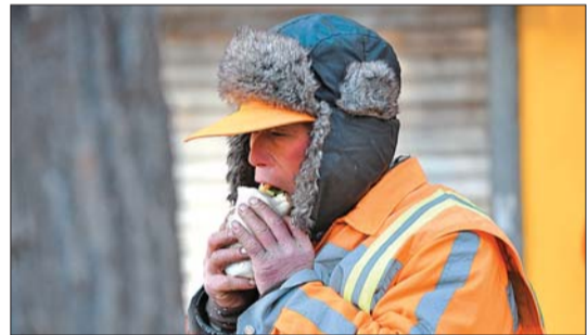
10日早晨,历山路上,一名环卫工在寒风中吃一份煎饼果子当早餐。