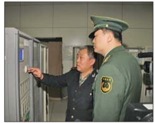
消防检查现场。通讯员 杨林 摄

据了解,省城公安消防部门将进一步加大监督检查力度,对检查中发现的消防违法行为和火灾隐患,坚决依法整治。