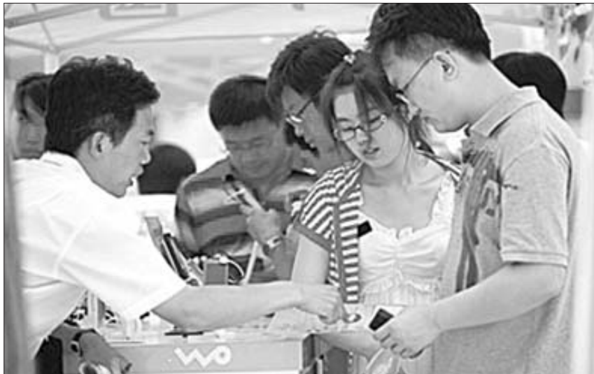
每到开学季,各大电信运营商都会展开肉搏,如何规范资费标准一直是用户关心的问题。 据人民网

据新华社北京2月15日电 近日,国务院印发《国务院关于取消和下放一批行政审批项目的决定》,再次取消和下放64项行政审批事项和18个子项。此外,国务院建议取消和下放6项依据有关法律设立的行政审批项目,将依照法定程序提请全国人大常委会修订有关法律。这是本届中央政府第五批取消和下放行政审批等事项,简政放权继续迈出坚实步伐。