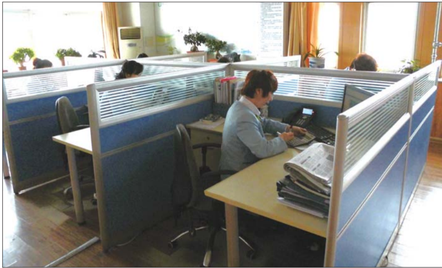
在新奥燃气95158热线服务中心,18名工作人员24小时三班倒接听电话。

中心有18名工作人员三班倒,24小时不停地接听电话。工作人员接听的,是需要人工服务的问题咨询,而用户通过其他途径发来的信息,会被自动存入到系统中。